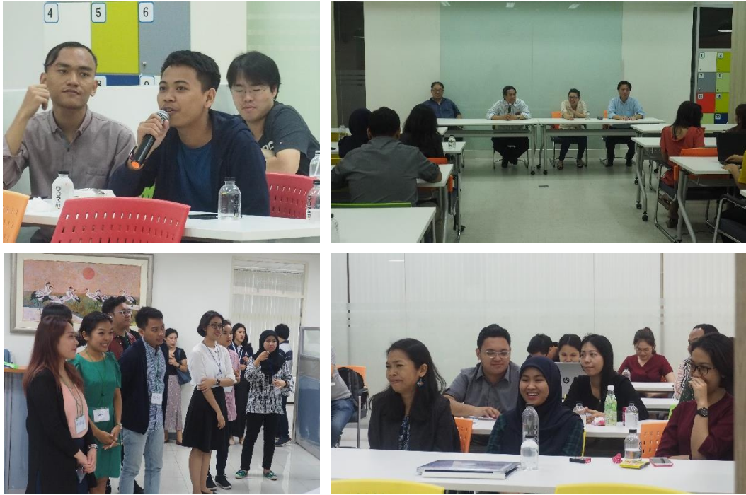
กิจกรรมปฐมนิเทศนักศึกษา รุ่นใหม่ รหัส 61