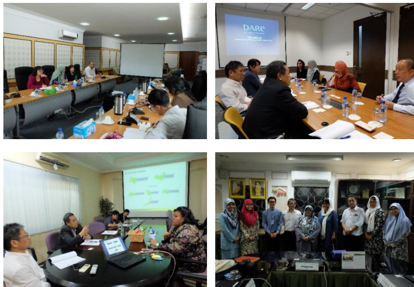
การสัมภาษณ์หน่วยงานต่าง ๆ ที่เกี่ยวข้องกับอุตสาหกรรมอาหารฮาลาลในประเทศบรูไน ดารุสซาลาม ระหว่างวันที่ 9 – 13 กรกฎาคม 2561

ในการดำเนินโครงการนี้ คณะนักวิจัยได้เดินทางไปสัมภาษณ์หน่วยงานที่มีส่วนเกี่ยวข้องในประเทศบรูไน ดารุสซาลาม ได้แก่ Brunei Economic Development Board (BEDB), Darussalam Enterprise (DARE), Ghanim International Corporation และ Halal Food Control Division, Department of Sharia Affairs, Ministry of Religious Affairs