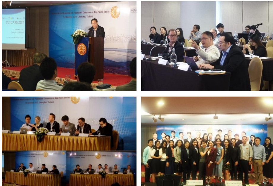
การประชุมวิชาการระดับนานาชาติ Thammasat Annual Academics and Post-Graduate Conference on Asia Pacific Studies (TU-CAPS) 2017

สำหรับนักศึกษาปริญญาโทและปริญญาเอกที่เข้าร่วมงานจาก Waseda University ประเทศญี่ปุ่น University of Canterbury ประเทศนิวซีแลนด์ นักศึกษาปริญญาโท หลักสูตรศิลปศาสตรมหาบัณฑิต สาขาวิชาเอเชียแปซิฟิกศึกษา (MAPS) จากมหาวิทยาลัยธรรมศาสตร์ และมหาวิทยาลัยแม่ฟ้าหลวง จำนวนทั้งสิ้น 23 คน