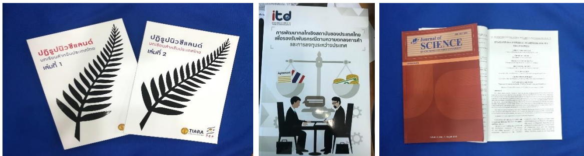
หนังสือและบทความในวารสารจากงานวิจัยของสถาบันฯ

นอกจากนี้ สถาบันอาณาบริเวณศึกษาฯ ได้ดำเนินการผลิตงานวิจัยผ่านทางหลักสูตรปริญญาโทศิลปศาสตรมหาบัณฑิต สาขาวิชาเอเชียแปซิฟิกศึกษา (MAPS) โดยสถาบันฯ ได้มีการจัดทำ Working Paper และ Conference Proceeding ซึ่งเอกสารเผยแพร่เหล่านี้มีผู้ประเมินทางวิชาการ โดยมีคณะกรรมการและกองบรรณาธิการ เป็นนักวิชาการจากประเทศไทย 8 คน และนักวิชาการต่างประเทศ 7 คน จาก Australian National University ประเทศออสเตรเลีย Copenhagen Business School ประเทศเดนมาร์ก City, University of London ประเทศอังกฤษ University of Canterbury ประเทศนิวซีแลนด์ และ Waseda University ประเทศญี่ปุ่น ทั้งนี้ ในปีงบประมาณ 2561 มี Working Paper ทั้งสิ้น 17 ฉบับ ดังนี้