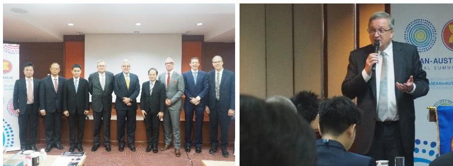
การบรรยาย เรื่อง “Australian, Thailand and the ASEAN-Australia Special Summit: Paths to Innovation, Security and Prosperity”