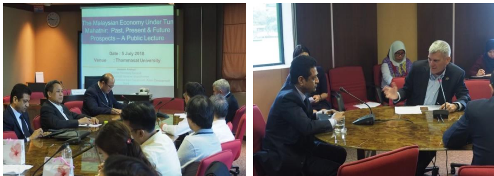
การประชุม เรื่อง “ Malaysian Economic Policy under Tun Mahathir: Past, Present & Future Prospects ”