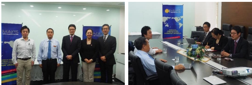
คณะอาจารย์จาก Ritsumeikan University เยี่ยมชมสถาบันอาณาบริเวณศึกษา และหารือการจัดกิจกรรมร่วมกัน

วันที่ 30 มีนาคม 2561 คณะอาจารย์จาก Ritsumeikan University ประเทศญี่ปุ่น เยี่ยมชมสถาบันฯ เพื่อหารือถึงการจัดกิจกรรมร่วมกันกับสถาบันอาณาบริเวณศึกษา