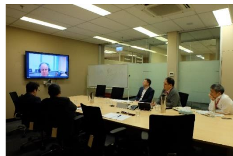
การสัมภาษณ์หน่วยงานต่าง ๆ ณ เมลเบิร์น เครือรัฐออสเตรเลีย ระหว่างวันที่ 30 กันยายน – 6 ตุลาคม 2561