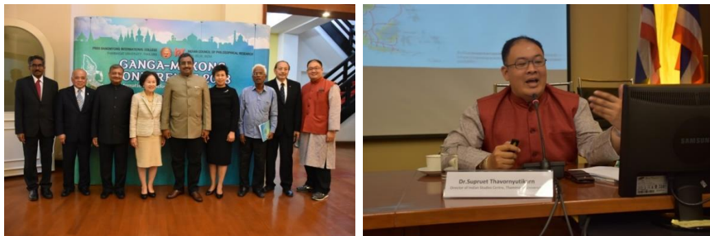
การประชุมวิชาการระดับนานาชาติ “GANGA – MEKONG CONFERENCE 2018”

ศูนย์อินเดียศึกษา สถาบันอาณานิคมศึกษา ร่วมกับวิทยาลัยนานาชาติปริดี พนมยงค์ มหาวิทยาลัยธรรมศาสตร์ และ India Council of Philosophical Research สาธารณรัฐอินเดีย จัดงานประชุมวิชาการนานาชาติ “Ganga – Mekong Conference 2018” เมื่อวันที่ 22 – 23 มีนาคม 2561 ณ ห้องประชุมสัญญาธรรมศักดิ์ และห้องประชุมวรรณไวทยากร อาคารโคมบริหาร มหาวิทยาลัยธรรมศาสตร์ ท่าพระจันทร์ โดยมีวัตถุประสงค์เพื่อเสริมสร้างและเชื่อมโยงกิจกรรมทั้งด้าน สังคม เศรษฐกิจ การเมือง วัฒนธรรม ภาษา และความร่วมมือทางวิชาการระหว่างประเทศอนุภูมิภาคลุ่มแม่น้ำโขงกับประเทศในลุ่มแม่น้ำคงคา ภายในงานยังมีการแสดงศิลปะการแสดงรำนาฏศิลป์อินเดีย ทั้งนี้ ได้รับเกียรติจาก Shri Ram Madhav, National General Secretary ของพรรค Bharatiya Janata Party (BJP) มาเป็นองค์ปาฐก และ H.E. Mr. Bhagwant Bishnoi เอกอัครราชทูตสาธารณรัฐอินเดียประจำประเทศไทยร่วมกล่าวต้อนรับ ในการนี้ ดร.ศุภฤกษ์ ถาวรฤทธิการต์ ผู้อำนวยการศูนย์อินเดียศึกษา ได้รับเกียรติเป็นวิทยากรและเป็นเจ้าภาพจัดเลี้ยงรับรองอาหารค่ำให้แก่ผู้เข้าร่วมงาน โดยมีผู้เข้าร่วมการประชุมจากสถานทูต ผู้ทรงคุณวุฒิและนักวิชาการ ผู้บริหารมหาวิทยาลัย และคณาจารย์ของวิทยาลัยฯ เข้าร่วมประมาณ 60 คน