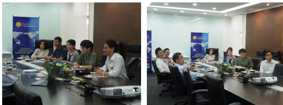
คณาจารย์จาก Kyoto University เข้าเยี่ยมชมสถาบันอาณานิคมศึกษา และพูดคุยถึงความร่วมมือในอนาคต

วันที่ 15 กุมภาพันธ์ 2561 คณาจารย์จาก Kyoto University นำโดย Director of the International Programme for East Asia Sustainable Economic Development Studies จาก Graduate School of Economics, Kyoto University ซึ่งเป็นมหาวิทยาลัยอันดับ 2 ของญี่ปุ่น เยี่ยมชมสถาบันอาณานิคมศึกษา และพูดคุยถึงความเป็นไปได้เกี่ยวกับการทำกิจกรรมร่วมกันและความร่วมมือในอนาคต