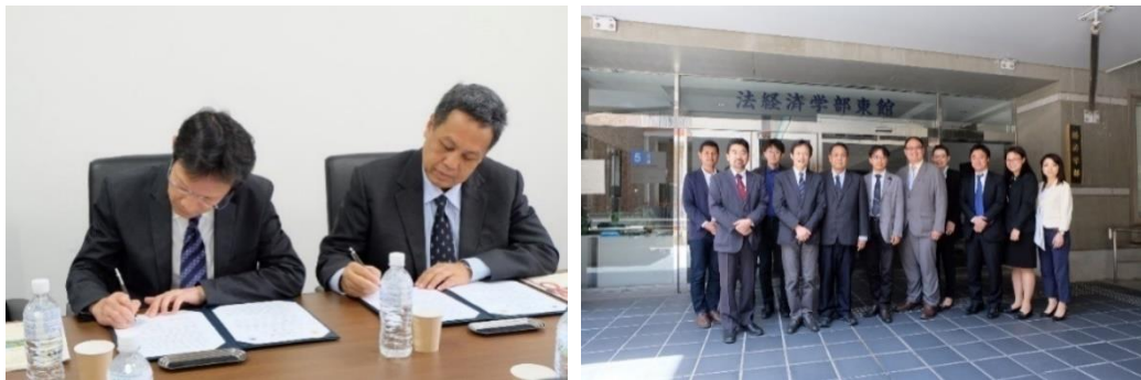
สถาบันอาณานิคมศึกษา มหาวิทยาลัยธรรมศาสตร์ ได้ลงนาม MOU กับ Graduate School of Economic, Kyoto University