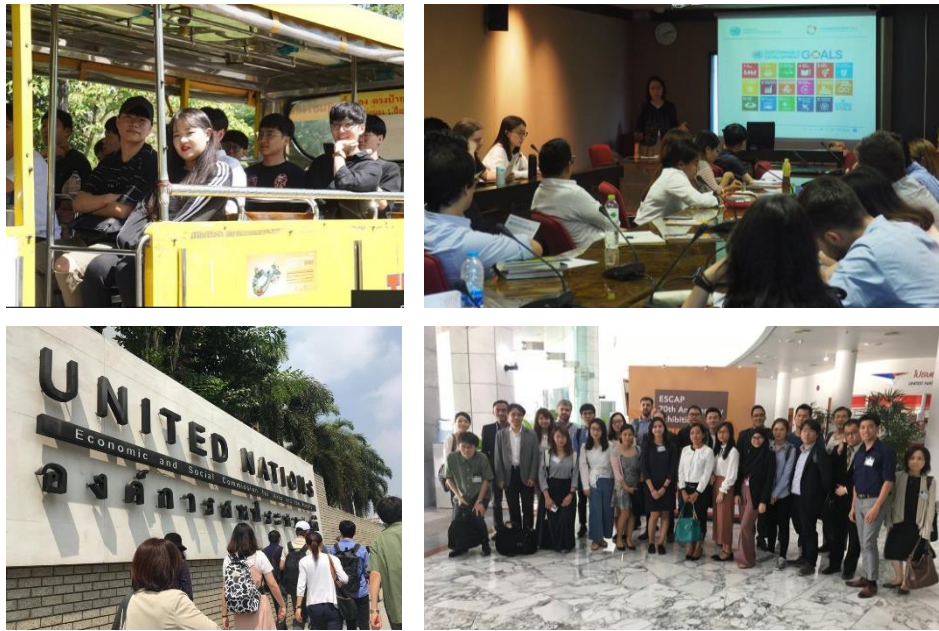
คณะอาจารย์และนักศึกษาจาก GSE, Kyoto University เดินทางมาทัศนศึกษาและทำกิจกรรมร่วมกับ สถาบันอาณาบริเวณศึกษาและนักศึกษา MAPS