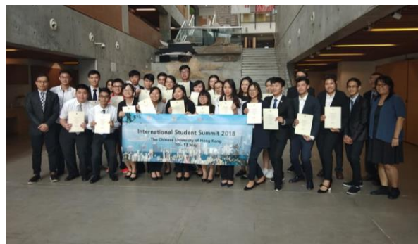
นักศึกษา MAPS เข้าร่วมและนำเสนอในงานใน International Students Summit 2018 ณ The Chinese University of Hong Kong (CUHK)