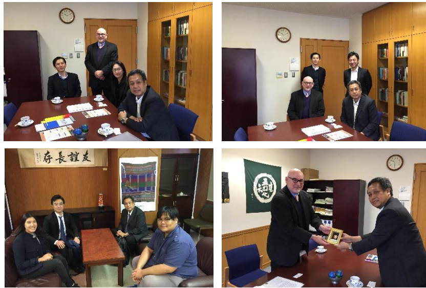
สถาบันอาณานิคมศึกษา ได้เดินทางไป Tokyo University และ Akita International University

เมื่อวันที่ 22 - 26 ตุลาคม 2560 คณะผู้บริหารสถาบันอาณานิคมศึกษา เดินทางไปประชุมหารือข้อตกลงความร่วมมือด้านวิชาการกับสถาบันการศึกษาในประเทศญี่ปุ่น ได้แก่ Tokyo University, Akita International University และ Master's Program in International Area Studies, Graduate School of Humanities and Social Sciences, University of Tsukuba รวมทั้งพบปะกับนักศึกษาหลักสูตรศิลปศาสตรมหาบัณฑิต สาขาวิชาเอเชียแปซิฟิกศึกษา ที่เดินทางไปเป็นนักศึกษาแลกเปลี่ยนกับ Yokohama City University อีกด้วย