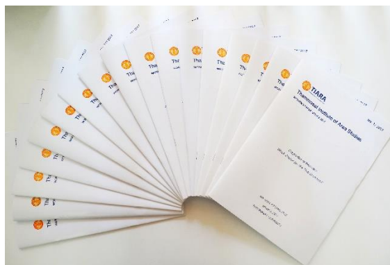
Working Paper ที่สถาบันฯ จัดทำ