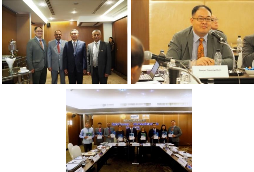
การเสวนาทางวิชาการ เรื่อง “Unblocking the Potential: Digital Economy in India & South East Asia”