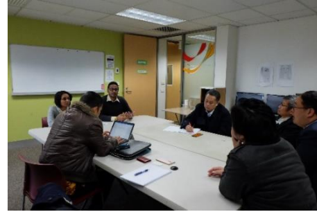
การสัมภาษณ์หน่วยงานต่าง ๆ ณ ซิดนีย์ และกรุงแคนเบอร์รา เครือรัฐออสเตรเลีย ระหว่างวันที่ 16 – 23 มิถุนายน 2561