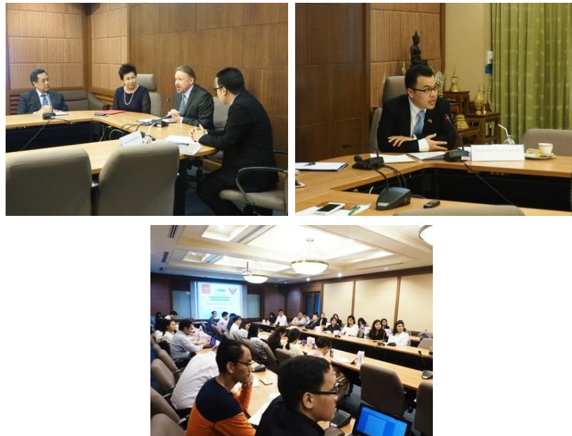
การบรรยาย เรื่อง “Enduring Determinants in Thai-Russian Relations”