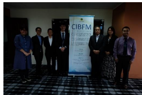
การสัมภาษณ์หน่วยงานต่าง ๆ ที่เกี่ยวข้องกับธนาคารอิสลามในประเทศบรูไน ดารุสซาลาม ระหว่างวันที่ 9 – 13 กรกฎาคม 2561