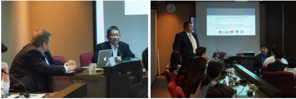
การบรรยายพิเศษ เรื่อง “Professionalism in the Local Government: the Roles and Functions of American City Managers”